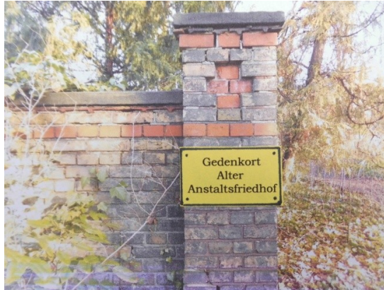
mögliche Kennzeichnung des Eingangsbereiches

Mit diesen Überlegungen und Vorschlägen wird sich der „Freundeskreis Alter Anstaltsfriedhof“ der ehemaligen Wittenauer Heilstätten bei der Vivantes GmbH sowie auf den politischen Ebenen des Bezirkes Reinickendorf und der Stadt Berlin für die Einrichtung eines würdigen und der historischen Entwicklung entsprechenden Gedenkortes Alter Anstaltsfriedhof einsetzen.