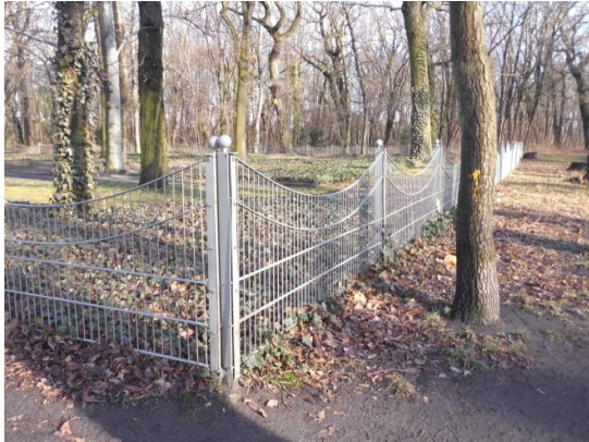
Umzäunung Kriegsgräberstätte Schönholzer Heide